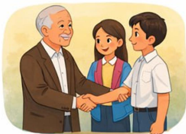
Munosabatlarni madaniyat bilan yo'lga qo'yish