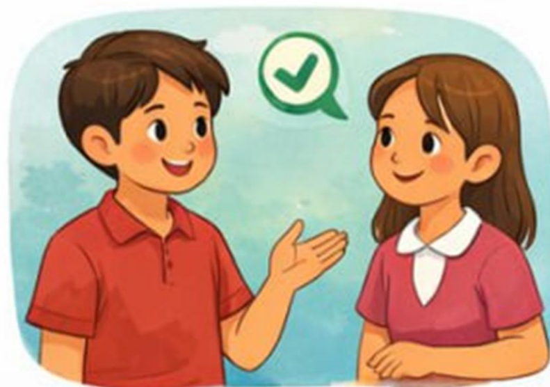
Xulosa chiqarish va yechim topish