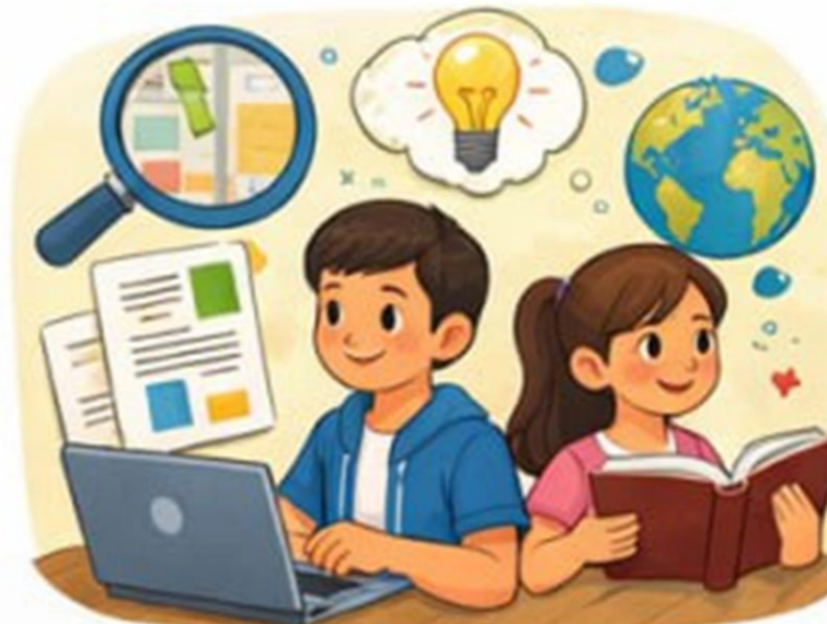
Axborotni izlash va tahlili qilish