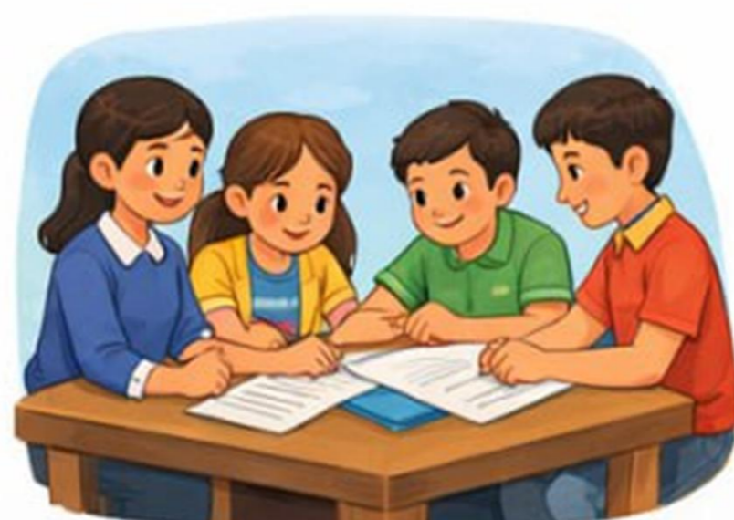
Jamoadam hamkorlikda ishlash