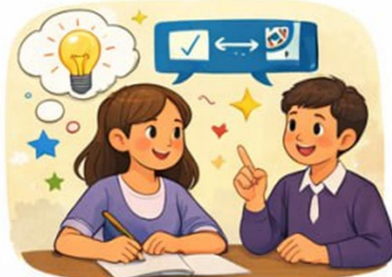
O'zini boshqarish va vaqtni to'g'ri taqsimlash