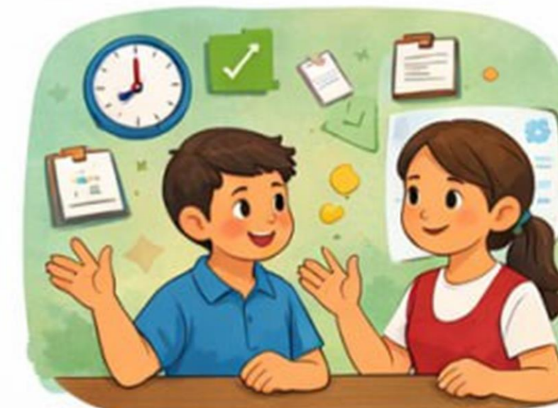
Muammolarni hal qilish