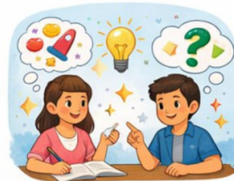
Ijodiy fikrlash va tasavvur qilish